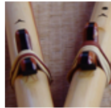
Heike Heß Monochord, Flöte